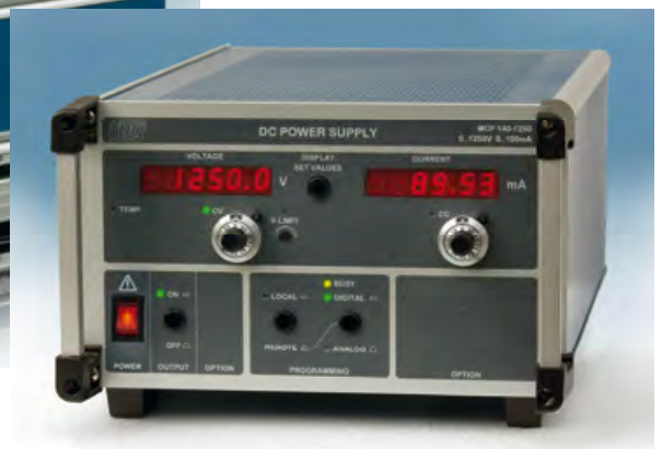
Design Example MCP 140 - 1250 1250V / 100mA